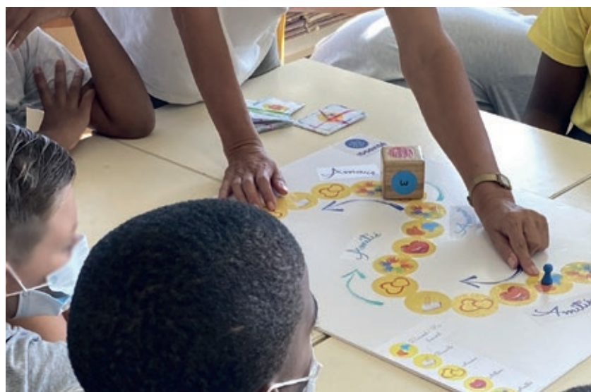
Un atelier sur la puberté dans une classe de CM2 à Cayenne.

Un directeur d'école élémentaire, Cayenne