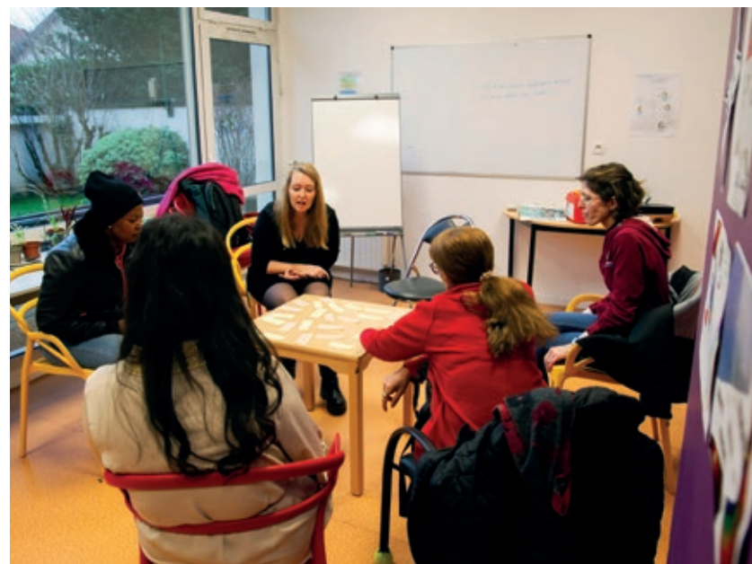
Au Jardin, les patients co-construisent la programmation des ateliers de prévention et de promotion de la santé avec une médiatrice.

Avec un an de fonctionnement et un accueil très positif de la part des habitants et des partenaires, le Jardin pense déjà à essayer ailleurs dans la région lyonnaise.