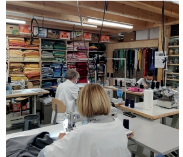
Durant leur année passée avec Tissons la Solidarité, outre leur formation, les femmes sont accompagnées par une conseillère en insertion professionnelle pour leur donner toutes les chances de retrouver un emploi.

Le réseau reçoit les invendus des marques de prêt-à-porter de renom et forme des femmes dans trois centres de transformation à Belfort, Caen et Charleville-Mézières. Là, elles apprennent à trier, anonymiser, détourner et valoriser les vêtements selon des fiches techniques et prototypes préparés par Tissons la Solidarité, en lien avec les enseignes partenaires. Une robe se transforme en jupe, des manches ballon deviennent droites... Une fois les nouvelles pièces prêtes, elles sont commercialisées dans les 125 boutiques du réseau, à un tarif moyen de 30 euros, soit un tarif très accessible pour un vêtement de cette gamme.