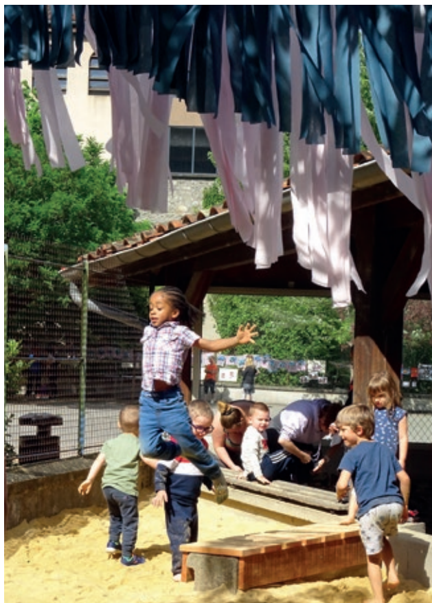
La conception et la réalisation des espaces permettent à des enfants en difficulté scolaire de révéler d'autres compétences.